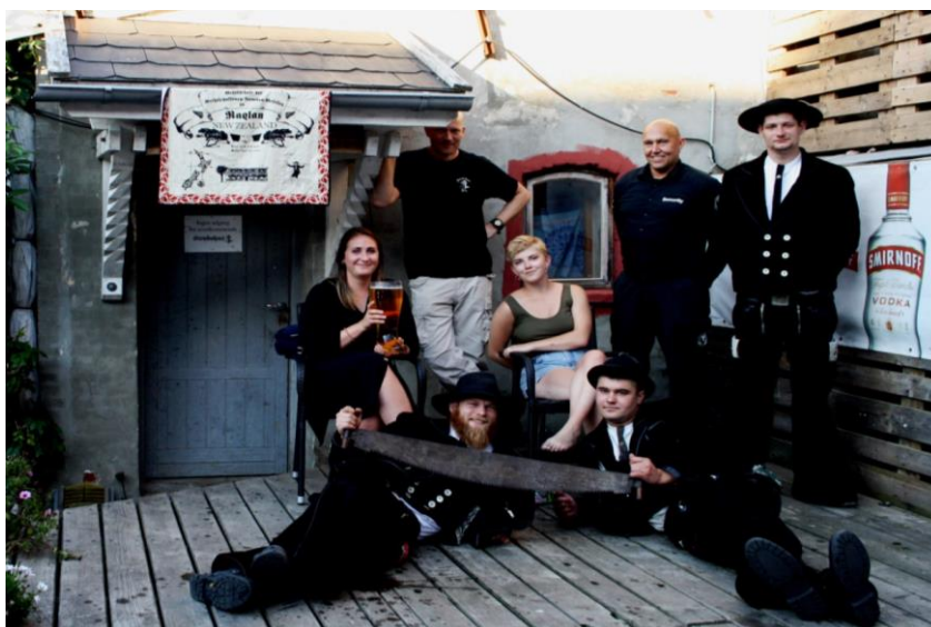
Navergården i Værtshuset Stenbohus' gård 2020